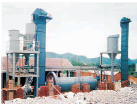
对耐火材料进行破碎