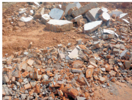
建筑垃圾破碎中的粗破