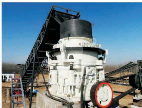
对河卵石进行破碎