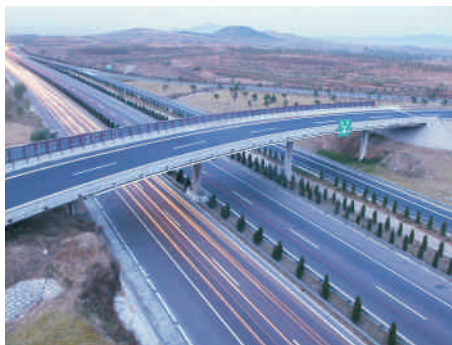
高速公路的机制砂生产和石料整形