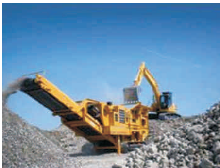
对建筑垃圾进行破碎